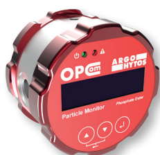
OPCom monitor částic