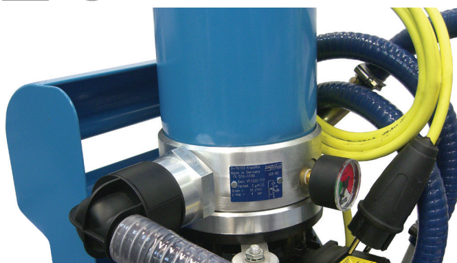
FA 016 s připevněnou sadou sacího sítka FA 016.1775