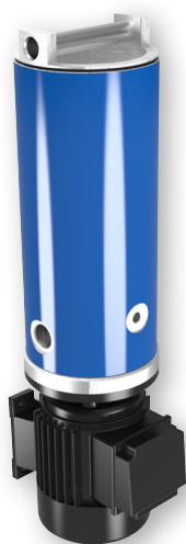
Agregát pro paralelní filtraci FNA 008/016