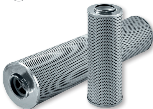
Filtrační vložka EXAPOR®AQUA