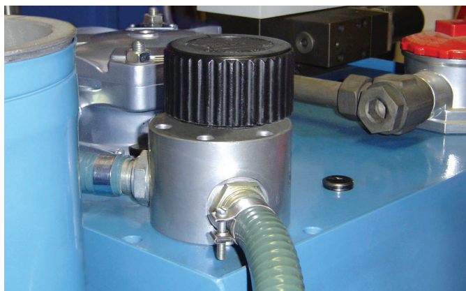
Montážní sada připevňená k nádrži